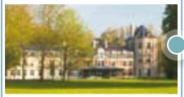
Château de Beaulieu