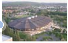
Stade couvert de Liévin