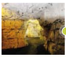
Les Boves d'Arras