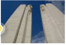
Mémorial de Vimy