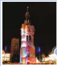
Beffroi de Béthune